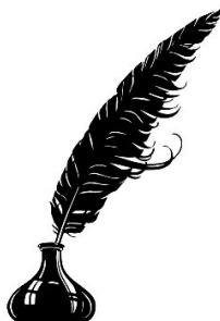
Pas de photo connue